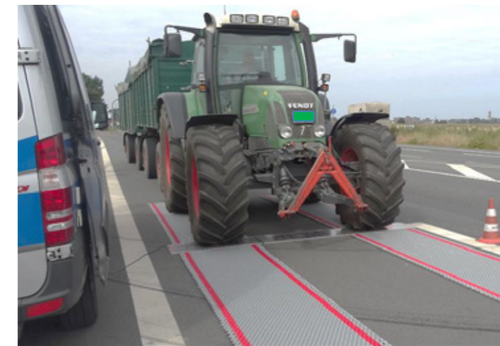
Mindestens 22% des Betriebsgewichtes des Zuges auf dem Traktor

22 % Adhäsionsgewicht für Fahrzeugkombinationen mit einer bauartbedingten Höchstgeschwindigkeit über 25 km/h bis 40 km/h. (Art. 67 Abs. 4 Bst. a VRV)