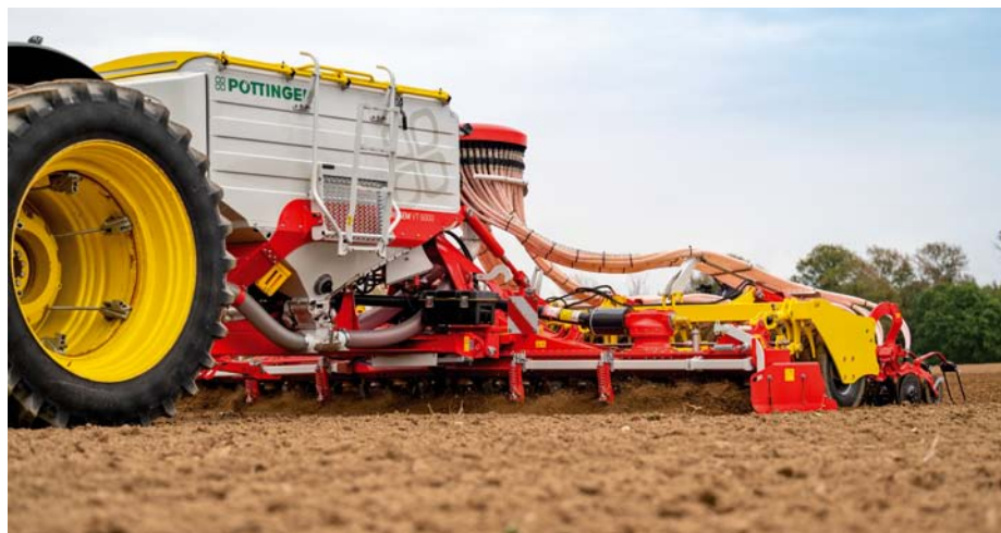
Maximálna manévrovateľnosť a optimálna ochrana pôdy.